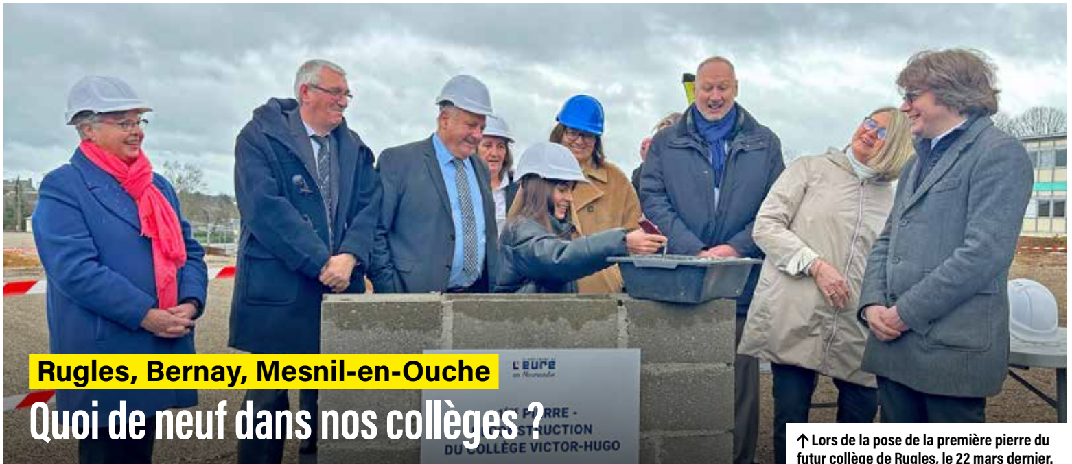
Rugles, Bernay, Mesnil-en-Ouche