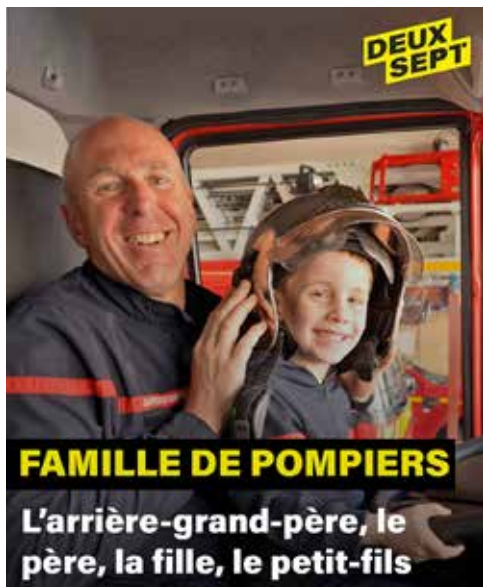
Famille de pompiers La famille de sapeurs-pompiers dans l' #Eure !