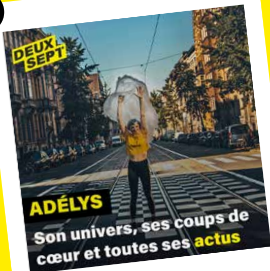
AdélyS Rendez-vous à l' @armadarouen2023 pour découvrir @adelysofficiel #armada2023 #armada #artiste #concert #normandie #eure