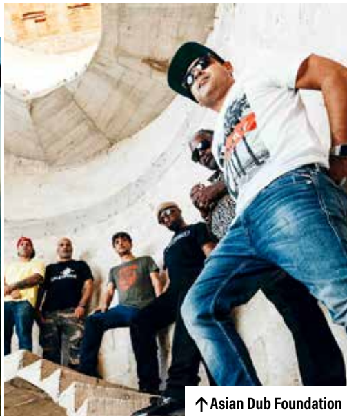
↑ Asian Dub Foundation