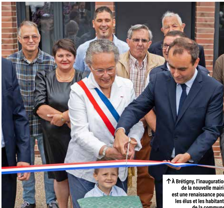
↑ À Brétigny, l'inauguration de la nouvelle mairie est une renaissance pour les élus et les habitants de la commune.

« Aujourd'hui, l'inauguration de cette mairie résonne singulièrement pendant cette période de violences urbaines, souligne Alexandre Rassaërt, président du Département. Un peu partout en France, des gens s'attaquent à des édifices qui symbolisent la République, l'État... Des bâtiments dont ils sont souvent utilisateurs. »