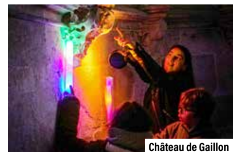
Château de Gaillon