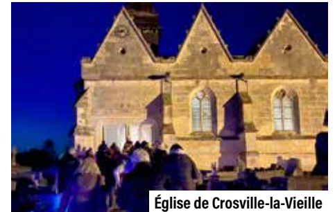
Église de Crosville-la-Vieille

Profitez de l'appel à projets du Département pour mettre en valeur votre patrimoine.