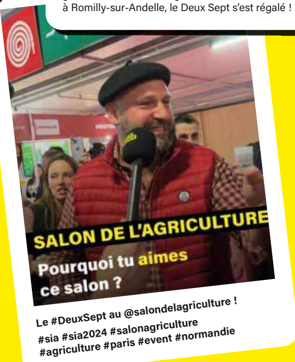
SALON DE L'AGRICULTURE Pourquoi tu aimes ce salon ?

Le #DeuxSept au @salondelagriculture ! #sia #sia2024 #salonagriculture #agriculture #paris #event #normandie