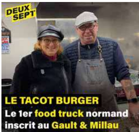
LE TACOT BURGER Le 1er food truck normand inscrit au Gault & Millau

Le 1 er food truck normand au Gault&Millau ! Chez Le Tacot Burger on déguste des burgers aux produits locaux et des frites maison cuites à la graisse de bœuf. Montagnard, normand, fermier... à Romilly-sur-Andelle, le Deux Sept s'est régalié !