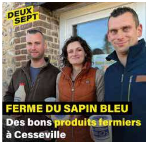
FERME DU SAPIN BLEU Des bons produits fermiers à Cesseville

Yaourts, glaces, flans, vacherins... Avec ses bons produits fermiers préparés et vendus à Cesseville, @La fermesapin bleu régale les Eurois. Découverte de cette ferme familiale depuis plusieurs générations.