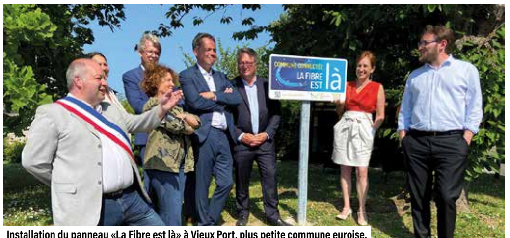
Installation du panneau «La Fibre est là» à Vieux Port, plus petite commune euroise.

La fibre THD (Très Haut Débit) est une technologie offrant une connexion Internet avec un débit descendant supérieur ou égal à 100 Mbit/s. Concrètement, le THD apporte des flux de données numériques qui sont beaucoup plus rapides ; la possibilité d'avoir plusieurs appareils connectés (PC, smartphone ou tablette) sans que cela impacte la qualité de la connexion ; enfin ce type de technologie a recours à Internet pour acheminer les communications téléphoniques.