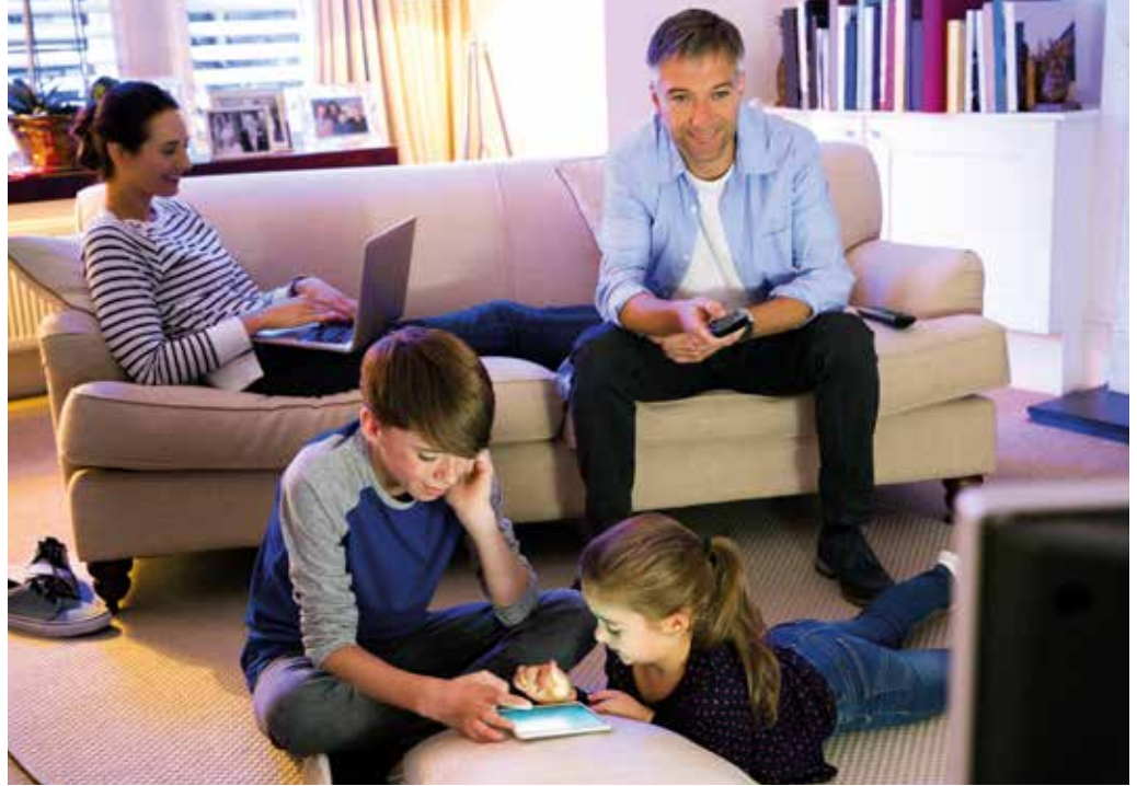
Le raccordement au réseau de la fibre optique est considéré aussi « essentiel » qu'un raccordement au réseau électrique ou à la distribution de l'eau.

numérique de Pont-Audemer, le festival musique & arts numériques Magnetik de Bernay (du 24 au 26 mai), ou encore le festival X.PO qui se tiendra dans les médiathèques de l'Eure, en ce mois d'avril (voir page 6).