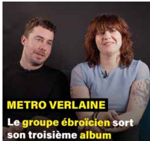
METRO VERLAINE Le groupe ébroïcien sort son troisième album

@metroverlaine dans la Boîte Noire du #DeuxSept ! #music #musique #group #artist #normandie #eure